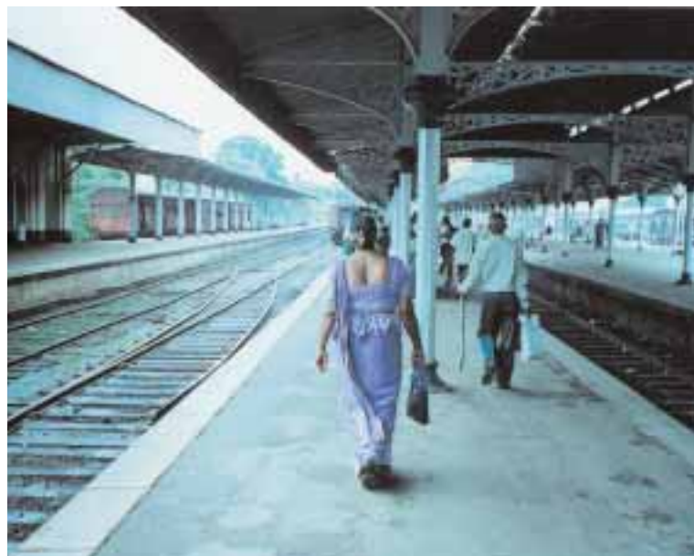
Eine Zugreise ist doppelt lohnenswert: Nur auf Schienen kann man den Alltag der Menschen und die Schönheiten der Landschaft gleichzeitig kennen lernen