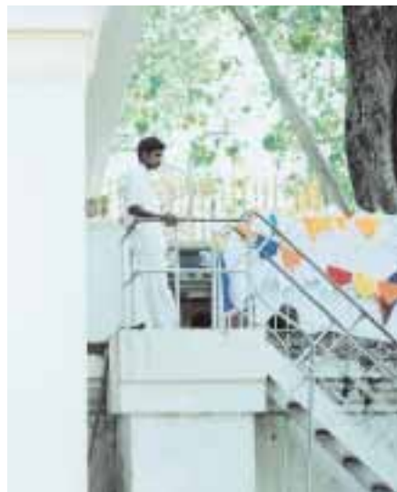
Ziel unzähliger Pilgerfahrten: Der gut geschützte Bodhi-Baum der Erleuchtung

lange spricht: der Bürgerkrieg. Singhalesen wie Tamilen erzählen, dass sie persönlich nichts gegen die anderen haben und dass nun endlich Zeit sei für Frieden. Und es sieht so aus, als sei es das wirklich. Die Friedensverhandlungen verlaufen erfolgreich, Sri Lanka gilt als sicheres Reise-land, in dem inzwischen auch der ehemals umkämpfte Norden und Osten der Insel wieder bereist werden können. Die Menschen erzählen lieber von ihrer Familie, von dem Haus, das sie gerade bauen, der Ausbildung, die sie machen, dem Job, den sie haben. Zeit zum Reden bleibt genug auf den langen Fahrten.